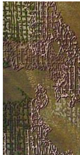
Вид 3 (Vagan ЗСУ)