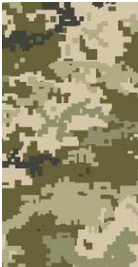
Вид 1 (ММ-14)